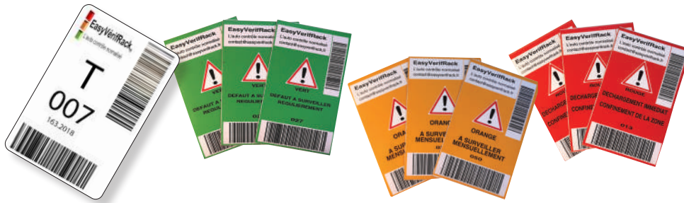
Étiquettes blanches géolocalisables + étiquettes magnétiques*.