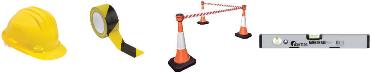
Nécessaire à la sécurité et au confinement*.

*Ces articles sont disponibles sur notre site internet www.easyverifrack.fr dans la rubrique "Easy équipement."