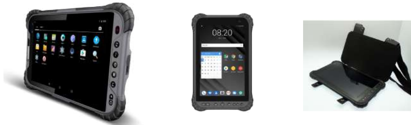
Tablette grand écran 8 pouces HD avec housse de protection*.