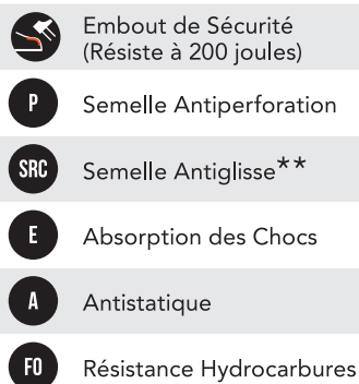
TABLEAU NIVEAU DE SÉCURITÉ