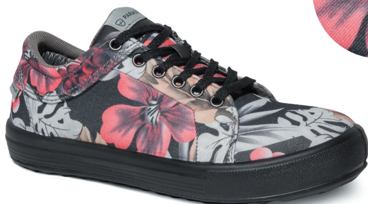
■ 7856 ROSE | POINTURE : 36 AU 42