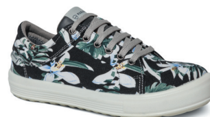
■ 7852 BLEU